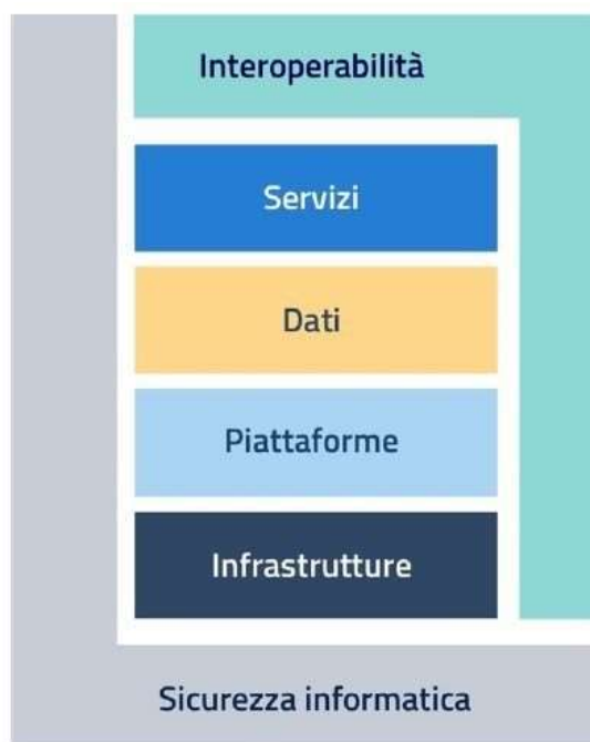
Figura 1 – Modello strategico di evoluzione del sistema informativo della Pubblica Amministrazione

Il modello strategico è stato schematizzato da AGID con la seguente figura: